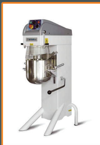
Миксер PL 20 CS

По желанию заказчика миксеры «STAR mix» комплектуются дополнительными дежами, месильными органами разных типов (венчик, венчик массивный, лопатка, крюк, спираль, скребок), каретками для перемещения деж по производственному цеху.