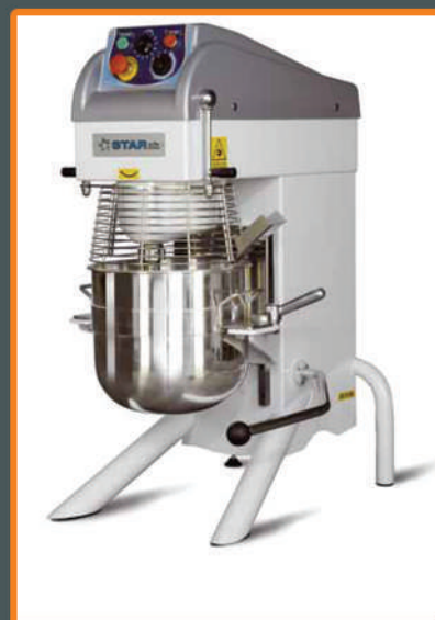
Миксер PL 20